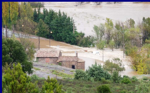
L'entrée Ouest du Village ... Au niveau de la Chapelle Saint-Roch, un véhicule emporté par le courant ...