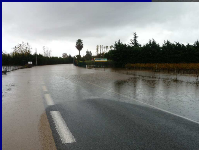
La sortie Est du Village ... au fond les pépinières et la station Total ...