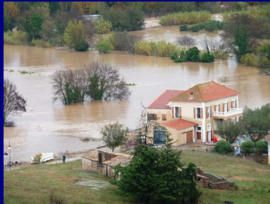
L'entrée Ouest du Village ... Les Premières maisons ...