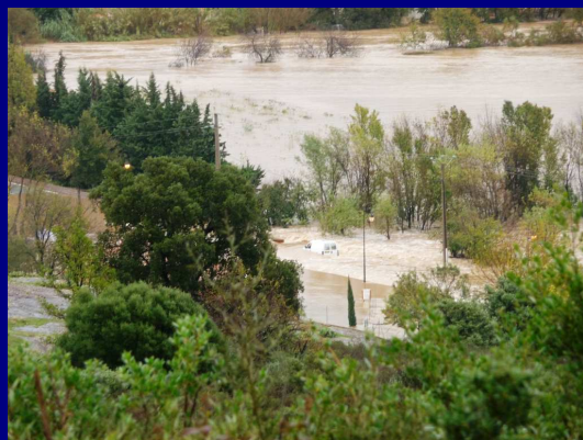
L'Argens et le lac de l'Aréna ...