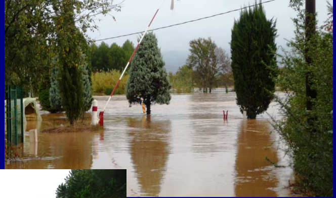
Ci-contre, l'eau au bas du collège André Cabasse au quartier de l'Isle