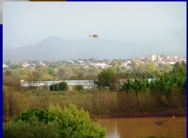
Ci-contre, un hélicoptère dans le ciel au dessus du quartier de l'Isle