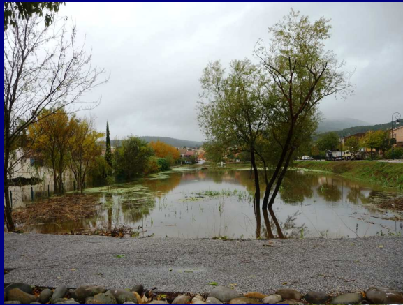
Ci-contre, le terrain situé au bas du Collège Cabasse le long de la voie d'accès ...