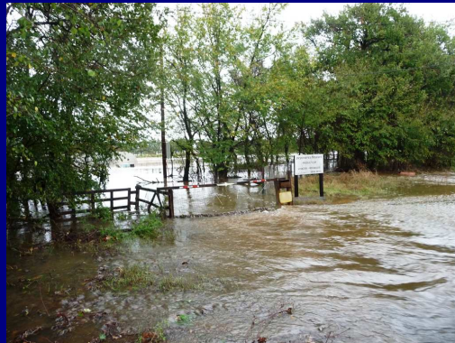
Le Chemin du Moulin des Iscles, un courant très fort ...