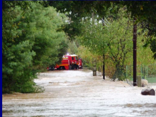
Les véhicules de l'USC de Nogent-le-Rotrou en faction sur la sortie Est du Village ...