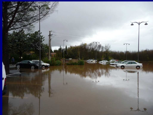
Parking des Douanes Accès ce soir à 17 h 00 ...