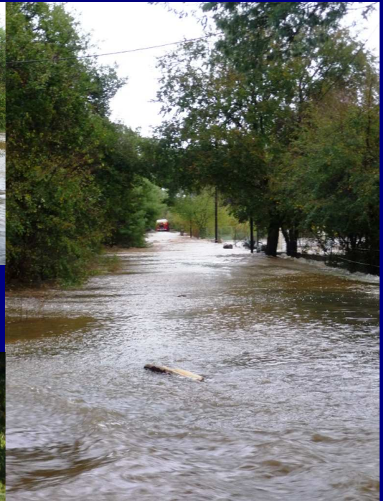
Un camion de pompiers manœuvre sur le chemin pour rebrousser chemin ...