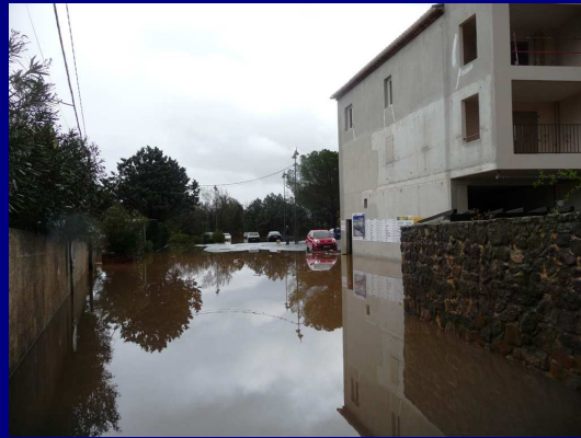
Parking des Douanes Accès ce matin à 9 h 00 ...