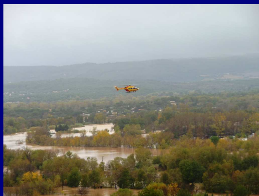
Les hélicos scrutent les zones inondées à la recherche de sinistrés ...