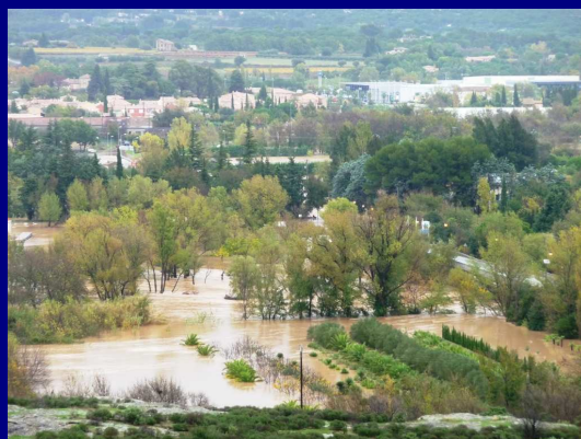
Les installations autour du lac de l'Aréna ... sous les eaux ...