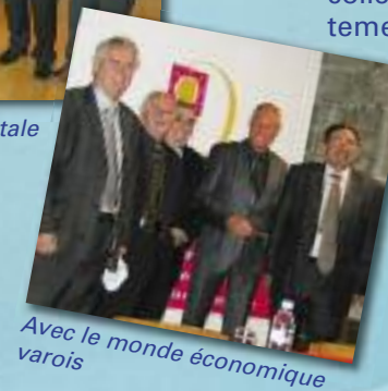
Avec le monde économique varois

collègues de la Majorité Départementale, nombreux Maires et élus varois qui ont apprécié son action au service des huit territoires varois, responsables économiques ou agricoles varois.