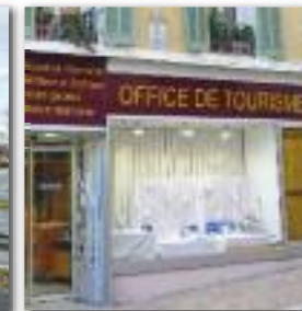
Soutien au tourisme