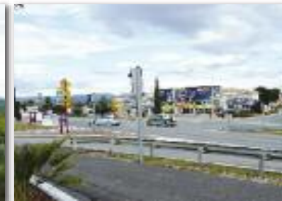
Bientôt un carrefour giratoire