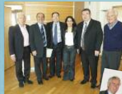
La Majorité Départementale