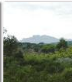
Des forêts à préserver