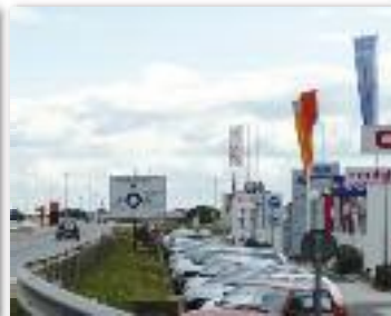
Des zones économiques à requalifier