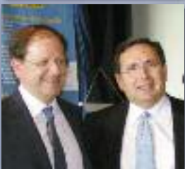
Avec Hervé Novelli

Président de la Commission Tourisme et de "Var Tourisme" l'Agence de Développement Touristique, il a mis en œuvre le schéma départemental avec les professionnels.