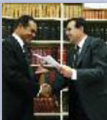
Avec Léon Bertrand

Président du Réseau National des Destinations Touristiques (RN2D - 100 départements) il est en relation avec les Ministres et Secrétaires d'Etat, ainsi qu'avec les principaux responsables nationaux du tourisme.