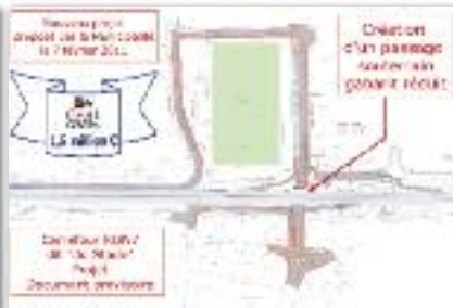
Nouveau projet au 7 février 2011