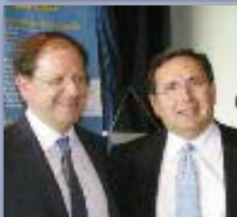
Avec Hervé Novelli

Président de la Commission Tourisme et de "Var Tourisme" l'Agence de Développement Touristique, il a mis en œuvre le schéma départemental avec les professionnels.