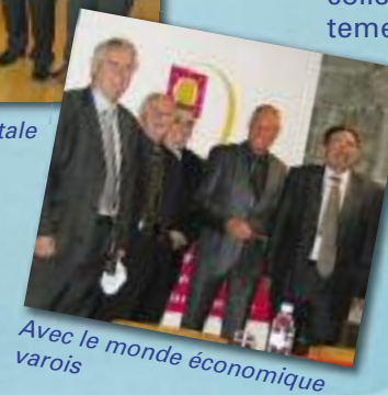
Avec le monde économique varois

collègues de la Majorité Départementale, nombreux Maires et élus varois qui ont apprécié son action au service des huit territoires varois, responsables économiques ou agricoles varois.