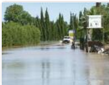
Mise hors d'eau des routes d'accès ...