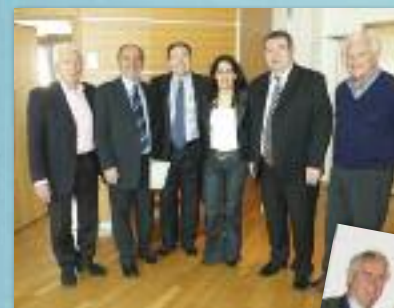
La Majorité Départementale