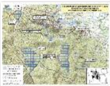
Espaces naturels départementaux dans Le Rocher ...