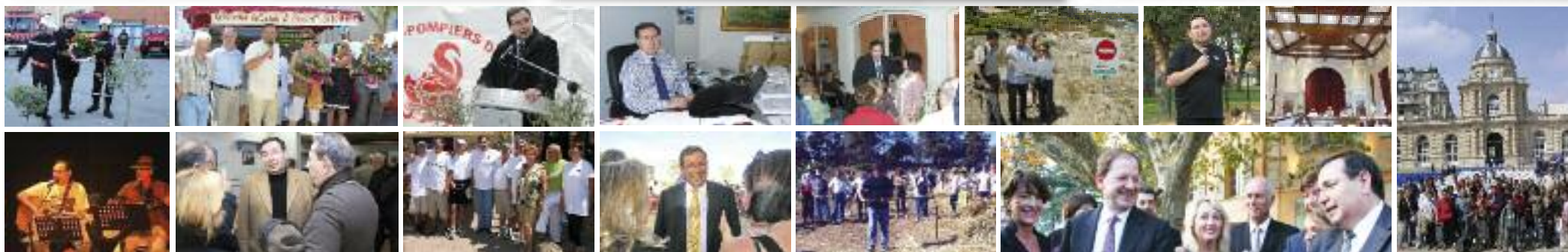
Sur scène avec les Z'Enfoirés de Puget ... Sur le terrain ... Dialogue ... Echanges .... La main à l'ouvrage pour nos traditions ... Avec le Ministre et le Préfet pour promouvoir l'oénotourisme ... Avec les collégiens du Muy au Sénat ...

Il est l'élu de tous, au service de son canton.