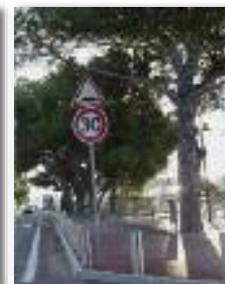
Toujours plus d'équipements pour tous ...