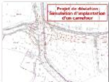
Déviation du village ...