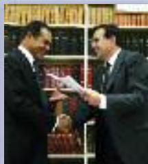
Avec Léon Bertrand

Président du Réseau National des Destinations Touristiques (RN2D - 100 départements) il est en relation avec les Ministres et Secrétaires d'Etat, ainsi qu'avec les principaux responsables nationaux du tourisme.