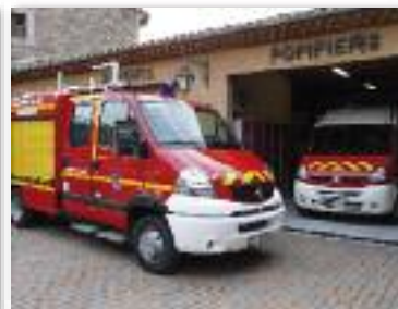
Centre de secours à transférer...