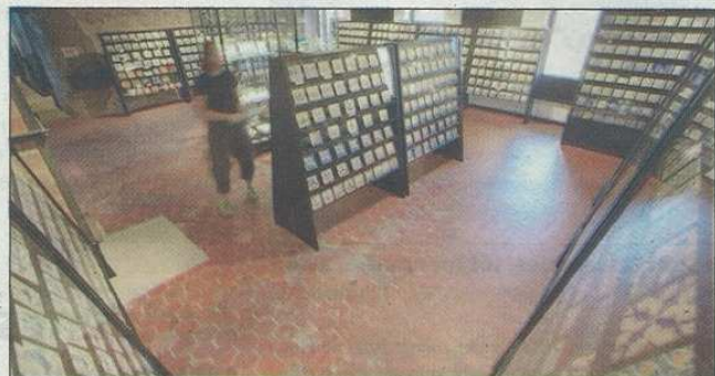
Le musée de la céramique Terra Rossa, à Salernes, a été visité, hier par les professionnels du tourisme.