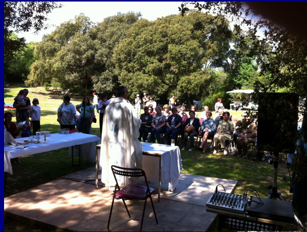
Dans la clairière du Jeu de Paume au pied du Rocher