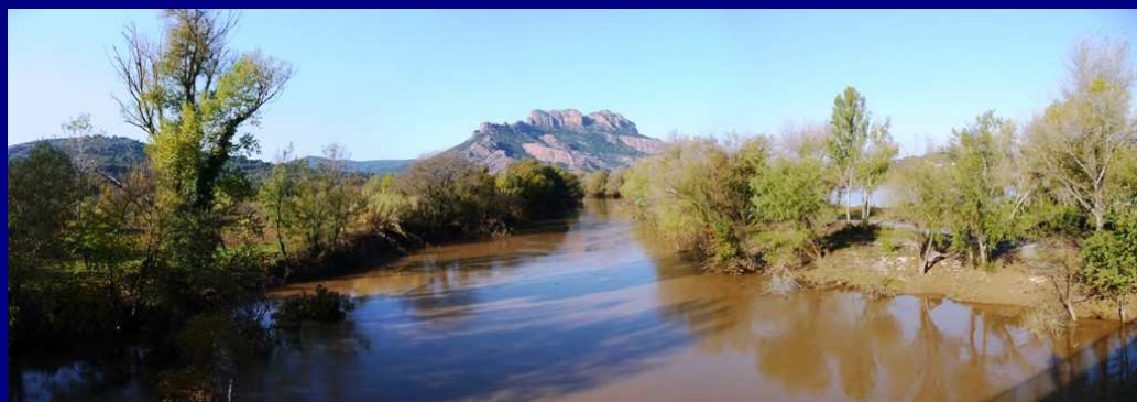
L'Argens sorti de son lit le 9 novembre ... La même vue du Pont du d'Argens le 12 novembre ... Ci-dessous, le vieux-pont d'Argens le 12 ...