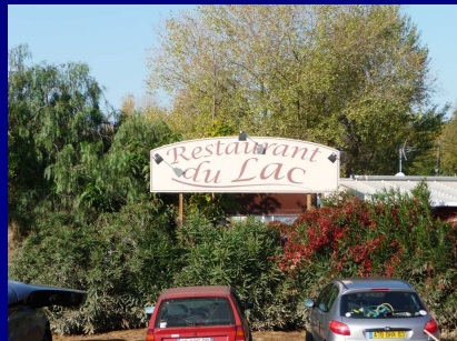
Le restaurant du Lac ... le 9 et le 12 novembre ...