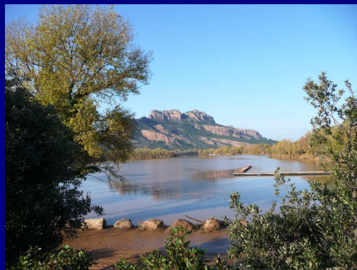
Le lac de l'Aréna ... A gauche le 9 novembre et à droite le 12 novembre ...