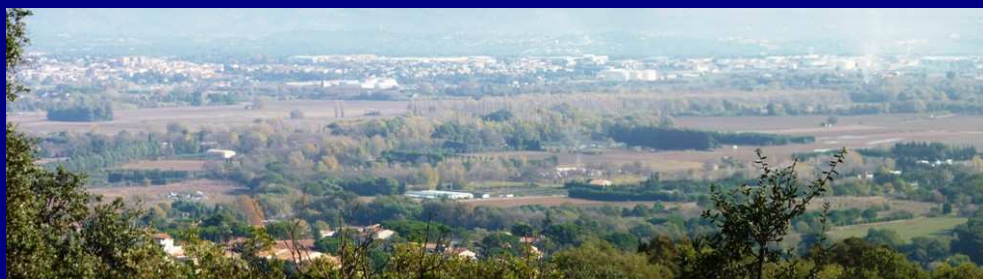
La basse vallée coté Est ... Enfin au sec ...