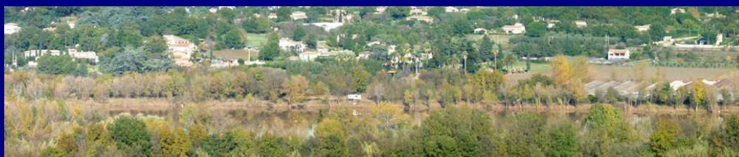
La vallée du de Sainte-Candie le 9 novembre ... Puis le 12 novembre ... Enfin au sec !