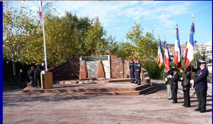
Lors de la cérémonie commémorant l'Armistice du 11 novembre 1918 au Mémorial du Combattant à Roquebrune-sur-Argens ... Jeunes pompiers et porte-drapeaux après les dépôts des gerbes ...