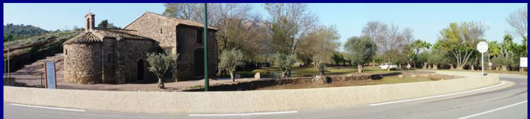
L'entrée Ouest du Village le 6 novembre ... Puis le 12 novembre ...