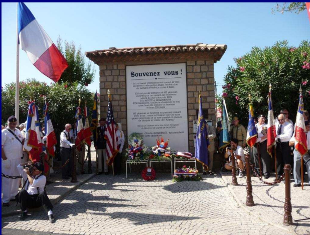
Le mémorial du Muy après les dépôts de gerbe ...