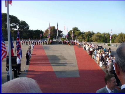
08 h 10 le 15/08/09 ... L'esplanade du Dramont avant l'arrivée des autorités