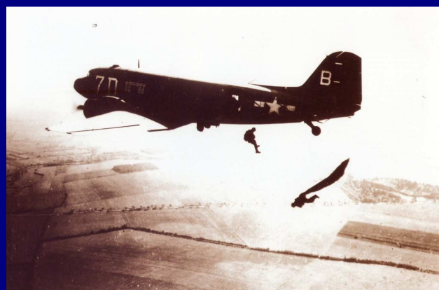
Parachutage sur le plateau du Mitan entre La Motte et Le Muy dans la nuit du 14 au 15 août 1944

Extrait de la plaquette commémorative du 60 ème anniversaire du Débarquement en Provence