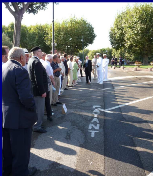
A FREJUS, devant le Monument aux Morts, ...