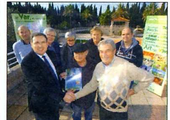
Le partenariat a été scellé sur le toit de la réception du camping de l'Étoile de l'Argens.

1. Quatre marchés au potentiel important sont prospectés : nord de la France, Belgique, Allemagne et Angleterre.