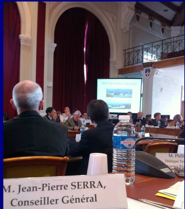
Jeudi 13 janvier, dans la salle Edouard Soldani du Conseil Général à Draguignan, lors de la présentation des conclusions du rapport des Inspecteurs Généraux de l'Administration sur les inondations survenues les 15 et 16 juin 2010 dans le Département du Var