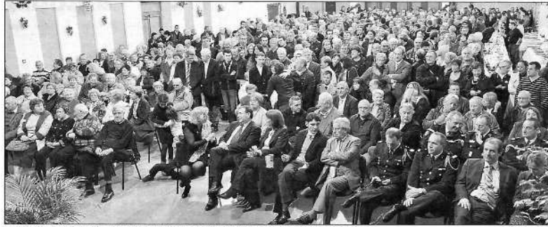
Au premier rang du public, de nombreux élus et représentants des collectivités territoriales.