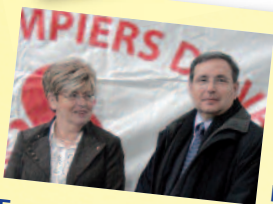
Madame, Mademoiselle, Monsieur,

Fidèle à ses valeurs et à son canton au service de tous au MUY, à ROQUEBRUNE LES ISSAMBRES et LA BOUVERIE à PUGET-SUR-ARGENS