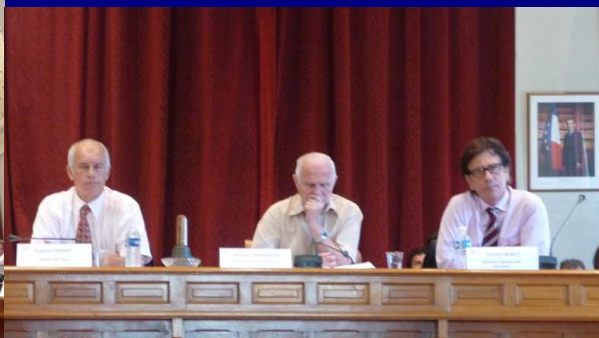
Réunion des Maires des Communes sinistrées dans la Salle Edouard Soldani à Draguignan ...