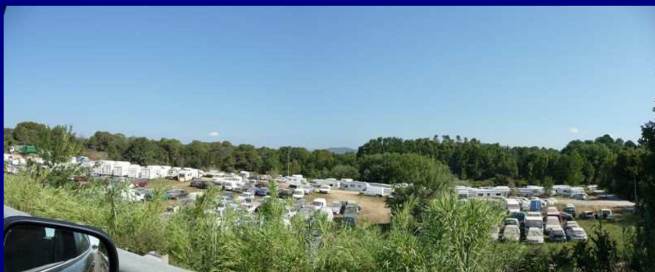
Vue d'ensemble du site des Castagniers ... Une partie des 15 000 véhicules sinistrés ...