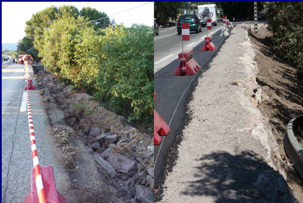
Travaux d'urgence réalisés par la Direction des Routes du Conseil Général : Les accotements de la RD7 entre le Pont d'Argens et le carrefour de la route du Lac et du chemin d'accès aux quartiers des Planets et Barbossi ...