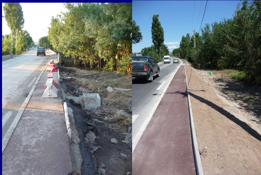
Travaux d'urgence réalisés par la Direction des Routes du Conseil Général à l'entrée du Village :