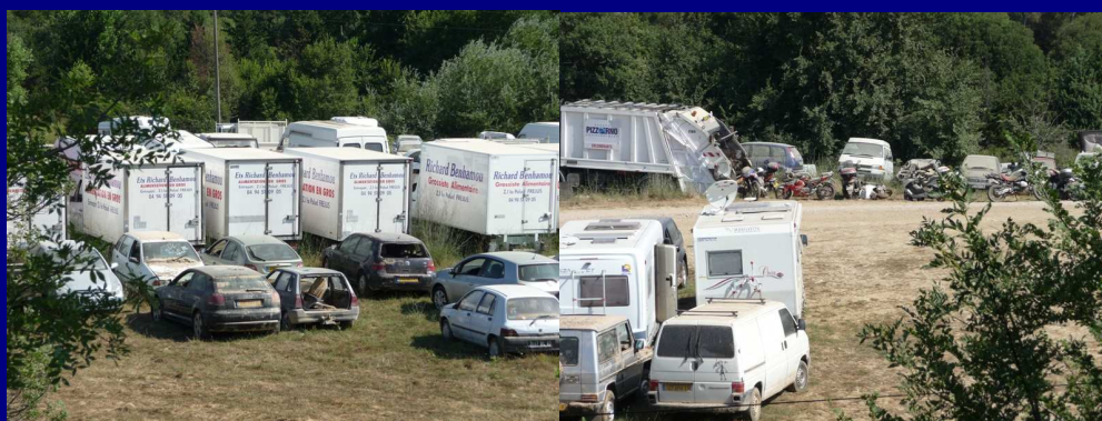
Sur le site des Castagniers, toutes sortes de véhicules sont entreposés : motos, voitures, camions, fourgons, camping-cars, caravanes ....