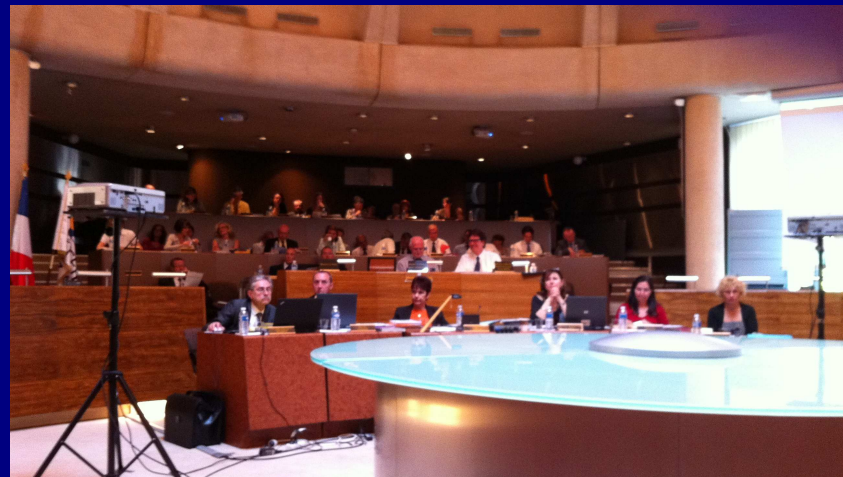
Au cours de la séance plénière du Conseil Général ...