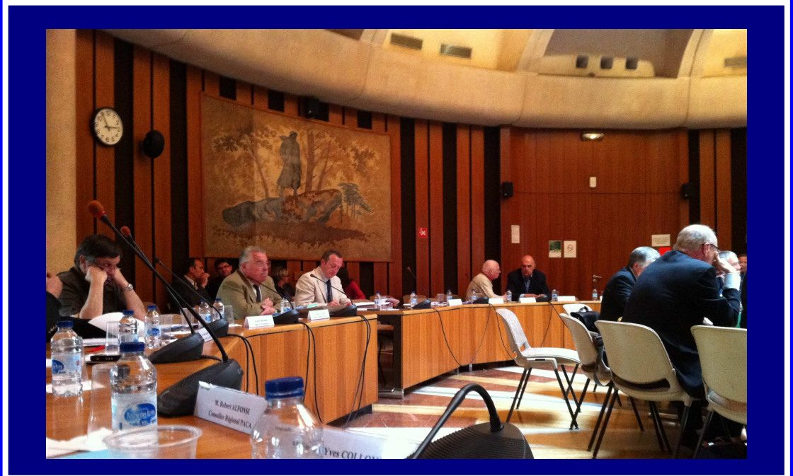
Les élus de la CDCI découvrent la carte des nouvelles intercommunalités proposée par M. le Préfet au cours de la réunion du 22/04/11